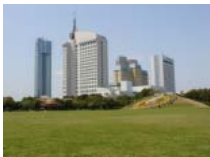
レース中にこんな景色が見られるかも

この幕張新都心のオアシスといえるのが「幕張海浜公園」です。公園内は美しい人工海岸・芝生・森林などバラエティに富んでいます。当日は、スピーディーなレース展開とともに、公園内や幕張新都心の景色も楽しめることでしょう。